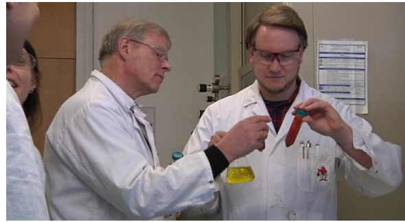
Forscher im Institut für Anorganische Chemie

Schiffe, deren Rümpfe von Algen und Muscheln bewachsen werden, bedeuten massive Schäden für die Schifffahrt. Denn das sogenannte Fouling verlangsamt die bewachsenen Schiffe. Eine Lösung bieten Anti-Fouling-Lacke. Doch diese enthalten oft giftige Stoffe wie Kupfer. Am Institut für Anorganische Chemie der JGU arbeiten die Forscher an einer Variante, die das Ökosystem schont: Anti-Fouling-Lacke mit Cerdioxid. CampusTV-Reporterin Eva Haimerl erklärt das Prinzip dieser Lacke.